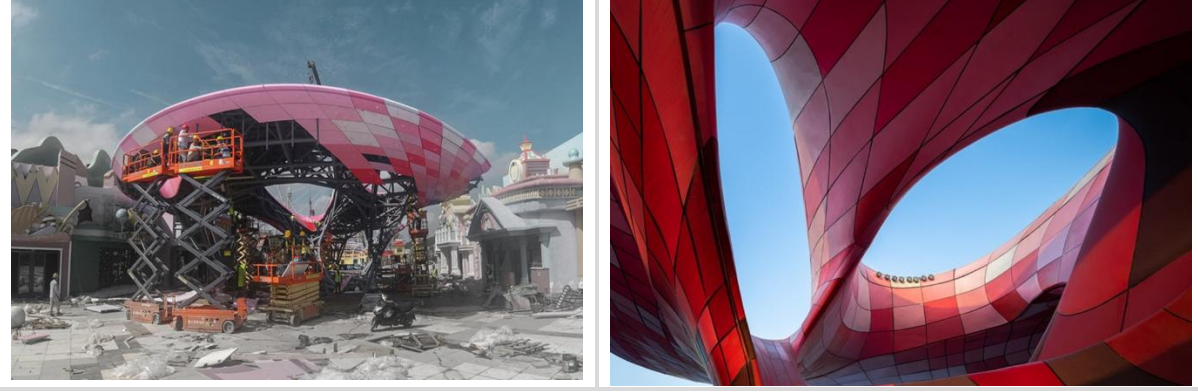
Görsel 4: 3D Baskılı Pavyon Archi-Union Architects + Fab-Union.

https://www.archdaily.cn/cn/963754/zhong-guo-3dda-yin-jian-zhu-ji-wei-lai-fa-zhan