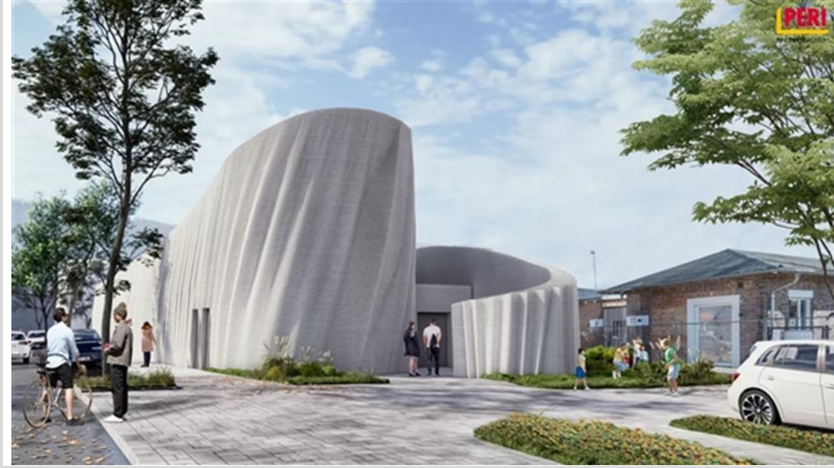
Görsel 8: Heidelberg Veri Merkezi, 49,4 X36,9 metre genişliğinde ve 9,1 metre yüksekliğinde

3D baskı teknolojisi, geleneksel yapı üretimindeki tasarım sınırlamalarını ortadan kaldırıyor ve mimarlara daha fazla tasarım özgürlüğü sağlıyor. Geleneksel üretim teknikleriyle elde edilmesi çoğu zaman zor veya maliyet açısından elverişsiz olan karmaşık geometrilere ve iç yapılara sahip mimari bileşenlerin oluşturulmasına olanak tanıyor. 3 boyutlu baskı teknolojisinin uygulanması, tasarımcıların mimari formları ve mekânsal organizasyonu daha özgürce keşfetmelerine olanak tanıyarak, mimari yeniliğin ve estetik ifadenin gelişmesini teşvik ediyor (Bkz. Görsel 8.).