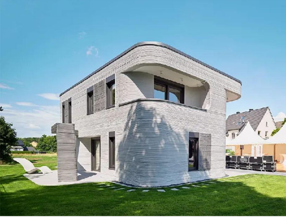
Görse1 7: Almanya'daki ilk 3D baskılı ev. (Her kattaki yaşam alanı 80 metrekare).

https://cn.wicinternet.org/2023-06/13/content_36628218.htm