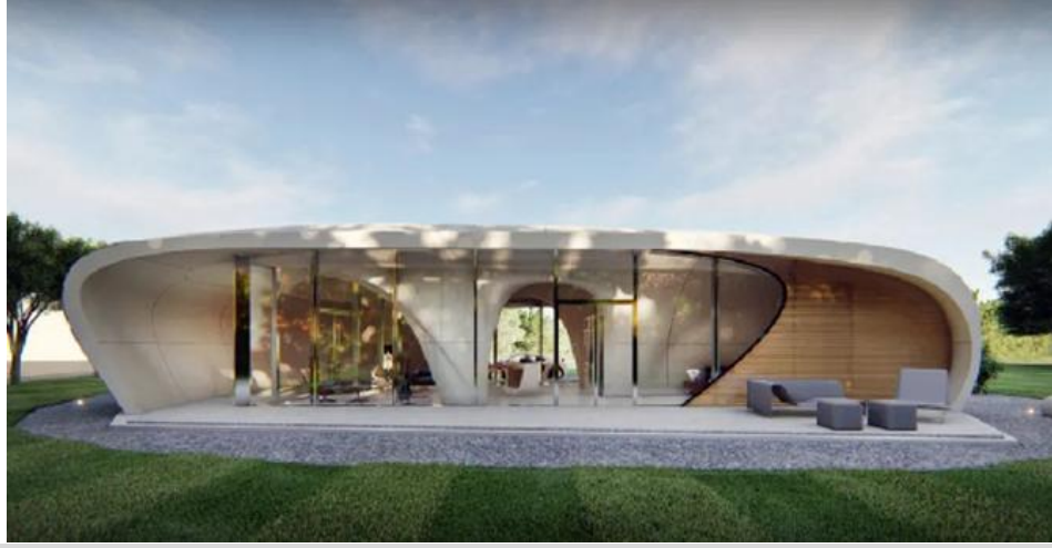
Görse1 6: ABD'deki "Curve Attraction" adlı ev, dünyanın ilk serbest biçimli 3D baskılı evi

https://cn.wicinternet.org/2023-06/13/content_36628218.htm