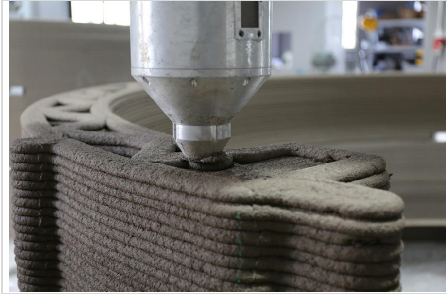
Görsel 1: 3D Baskılı Beton Ev İnşası, Profesör XU Weiguo'nun Ekibi https://www.archdaily.cn/cn/963754/zhong-guo-3dda-yin-jian-zhu-ji-wei-lai-fa-zhan

Dijital üretimde son teknoloji olan 3D baskı teknolojisi, karmaşık üç boyutlu nesnelere yazdırılabilir dijital bilgilere dönüştürülmesi ve bilgisayar destekli tasarım (CAD) yazılımları aracılığıyla üç boyutlu modeller oluşturulmasına odaklanmaktadır. Daha sonra bu modeller bir dizi ince katmana dilimlenir. Bu bilgilerden yola çıkılarak 3 boyutlu yazıcı, plastik, metal, beton vb. gibi belirli baskı malzemelerini kullanarak bunları katman katman istifleyip katılaştırıyor ve böylece istenilen üç boyutlu yapıyı oluşturuyor (Bkz. Görsel 1.)