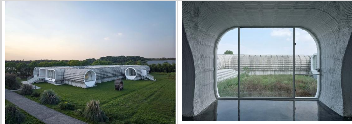
Görsel 5: Jiaxing, Zhejiang, Yikao Mimarlık'ın 3 boyutlu beton baskıyla üretilen "Tian Sanat Müzesi"

Her ne kadar henüz araştırma aşamasında olsa da genel olarak yapı baskısı büyük bir potansiyel göstermektedir. Tüm bina baskısı, bina tasarımını doğrudan baskı talimatlarına dönüştürerek ve şantiyede inşaatı yürütmek için robotik kollar gibi otomatik ekipmanlar kullanarak inşaat hızını ve doğruluğunu büyük ölçüde artırır. Bu yaklaşım aynı zamanda inşaat atıklarının ve çevre kirliliğinin azaltılmasına da katkı sağlıyor, yeşil bina ve sürdürülebilir kalkınma kavramlarıyla da örtüşüyor. Ancak genel olarak yapı baskısı, yapısal güvenlik, dayanıklılık ve ekonomi açısından hala zorluklarla karşı karşıyadır ve bu da daha fazla teknik araştırma ve pratik doğrulama gerektirmektedir (Bkz. Görsel 5.).