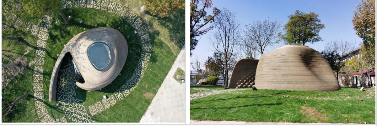
Görsel 2: 3D Baskılı Beton Kitap Kabini, Profesör XU Weiguo'nun Ekibi https://www.archdaily.cn/cn/963754/zhong-guo-3dda-yin-jian-zhu-ji-wei-lai-fa-zhan